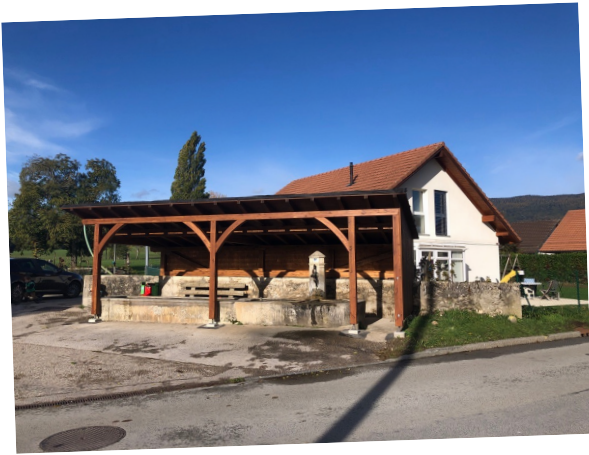
Fontaine du Pontet,

la Municipalité, accompagnée par la population de Saubraz, a inauguré quelques éléments de notre patrimoine.