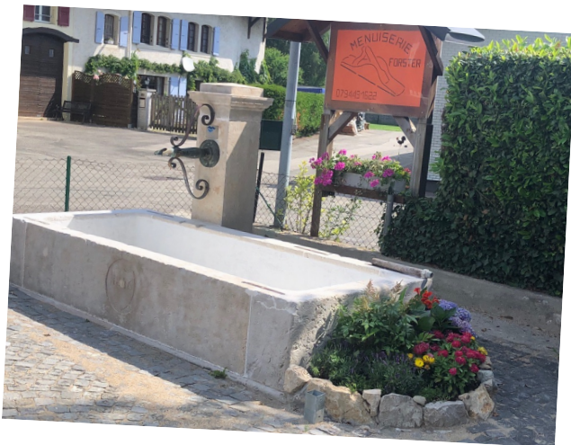
Fontaine, route de Bière

Pose d'une plaque commémorative en hommage à M. Roger Gros, généreux donateur